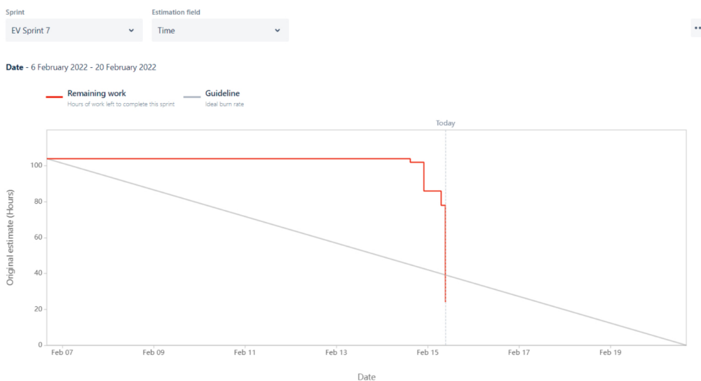
Burndown chart podľa ukončených úloh