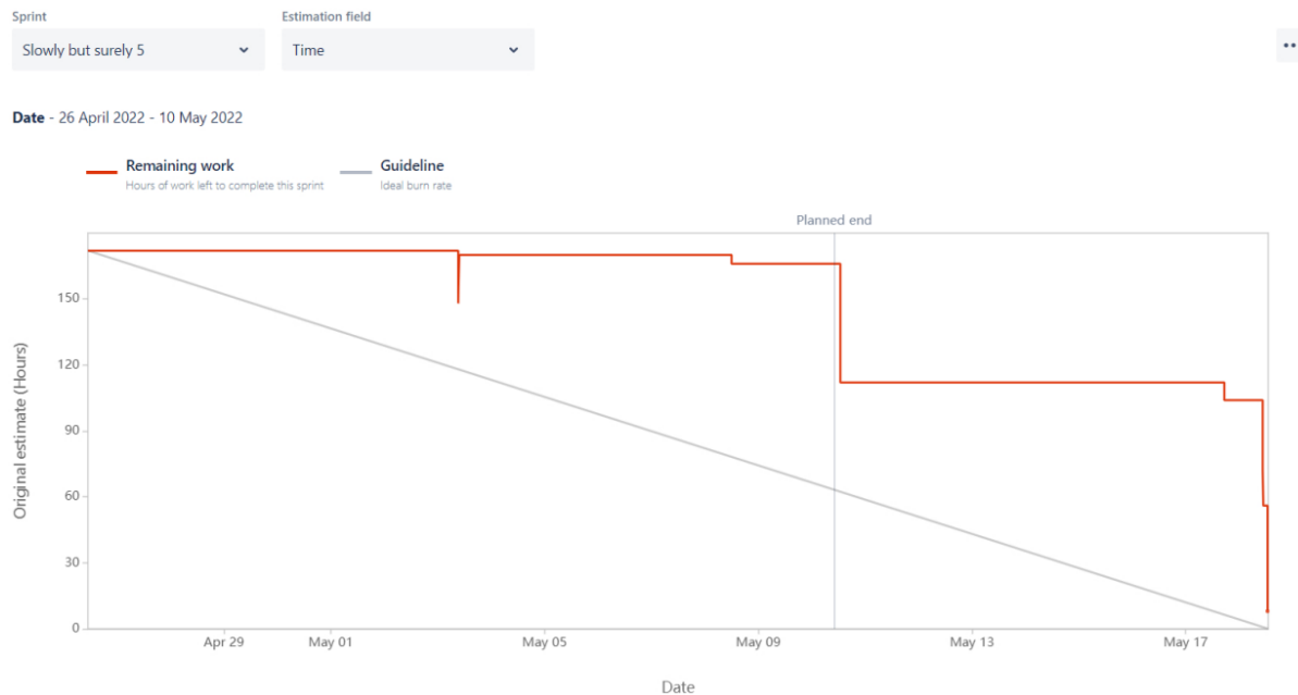
Burndown chart podľa ukončených úloh

Z diagramu vidno, že väčšina úloh bola označená ako DONE priebežne avšak s miernym omeškáním. Na konci sa presunulo do stavu DONE väčšie množstvo úloh, preto môžeme vidieť značný pokles na grafe vykázaného času.