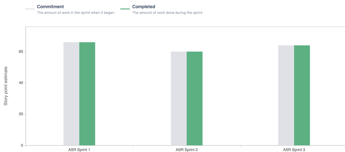
Obr. 2: Velocity report