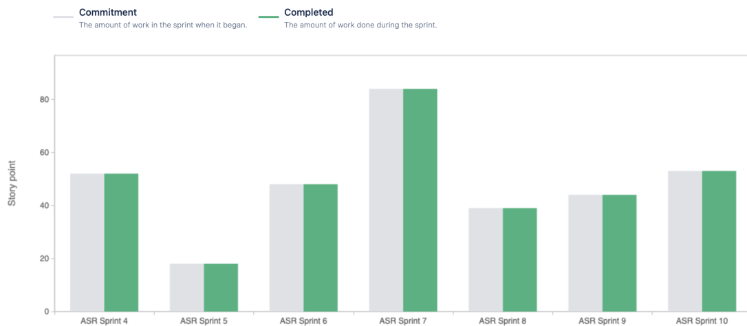
Obr. 2: Velocity report