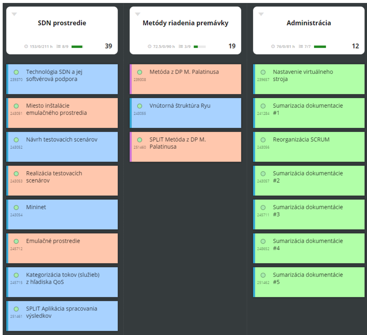
Obrázok 3 Rozdelenie user stories