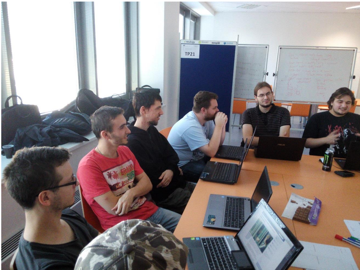
Spracoval: Martin Kyseľ