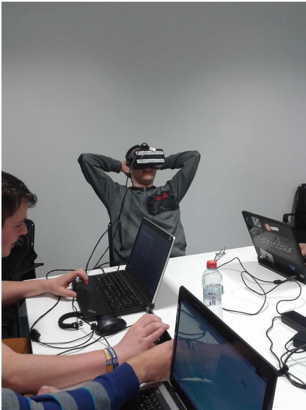
Obrázok č.1: Na obrázku je znázornené, ako členovia tímu testujú prototyp s požičaným Oculus Rift.